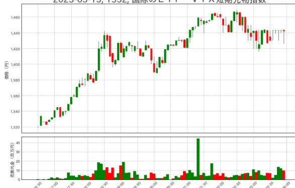
2023-03-13, 1552, 国際ETF VIX 短期先物指数