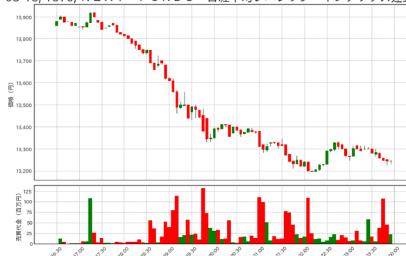
2023-03-15, 1570, NEXT FUNDS 日経平均レバレッジ・インデックス連動型上場投信