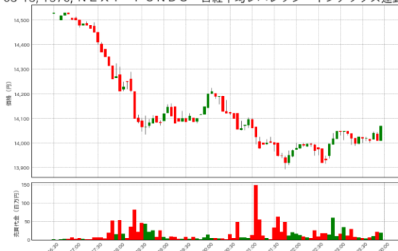
2023-03-13, 1570, NEXT FUNDS 日経平均レバレッジ・インデックス連動型上場投信